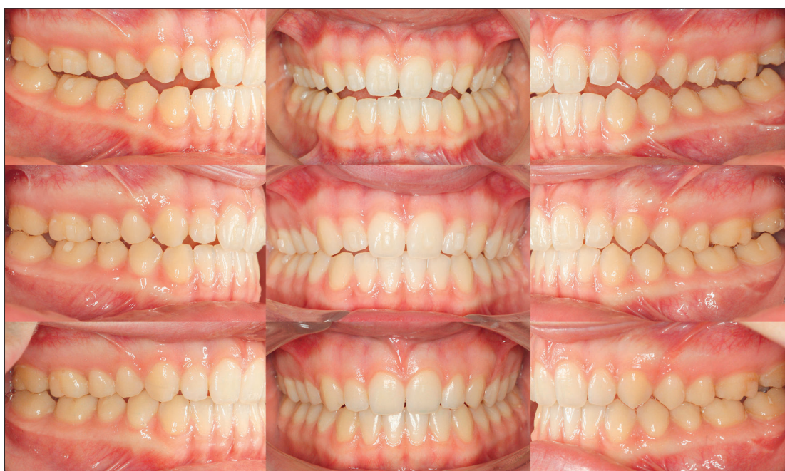
Abb. 9: Darstellung des Behandlungsverlaufs. Oben: Beginn der Behandlung, Mitte: Beginn der zweiten Phase. Unten: finales Resultat mit vertikaler posteriorer Abstützung