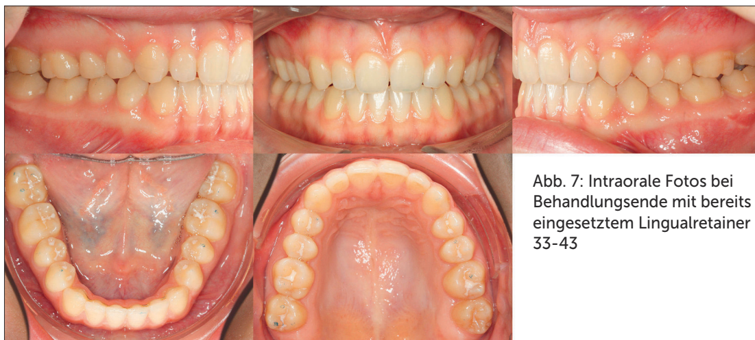
Abb. 7: Intraorale Fotos bei Behandlungsende mit bereits eingesetztem Lingualretainer 33-43