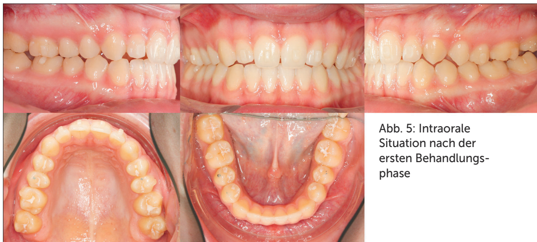
Abb. 5: Intraorale Situation nach der ersten Behandlungsphase