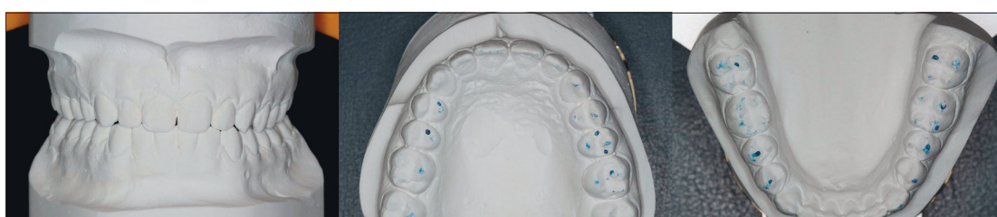
Abb. 8: Montierte Modelle in Zentrik mit vertikaler Abstützung auf allen Prämolaren und Molaren